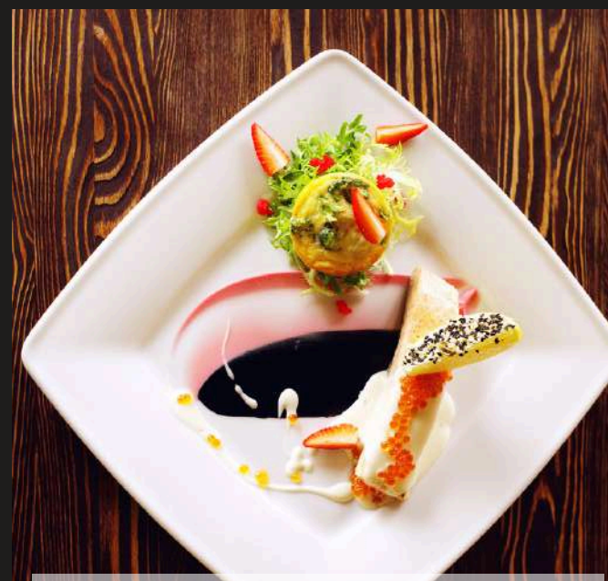
ЛОСОСЬ СУ-ВИД С СУФЛЕ ИЗ БРОККОЛИ И ИКОРНЫМ СОУСОМ 1260 ₺ ФИЛЕ ЛОСОСЯ, СУФЛЕ ИЗ БРОККОЛИ, СОУС БЕЛОЕ ВИНО (НА ОСНОВЕ СЛИВОК), КРАСНАЯ ИКРА 150/50 г