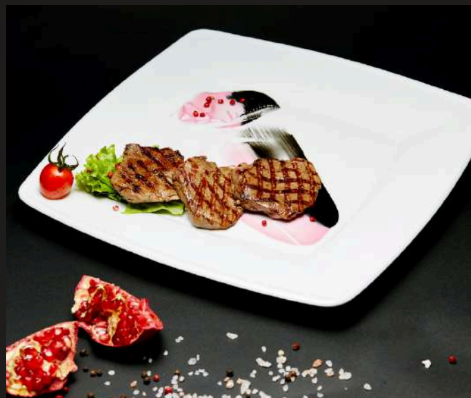
МЕДАЛЬОНЫ ИЗ ФИЛЕ ГОВЯДИНЫ 150 г 830 ₺