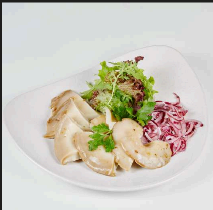
ГРУЗДИ СО СМЕТАНОЙ 150/50 Г 690 ₺