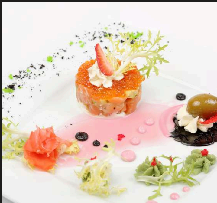
ТАРТАР ИЗ ЛОСОСЯ 1450 ₺ ФИЛЕ СЕМГИ, АВОКАДО, ТВОРОЖНЫЙ СЫР, ИКРА ЛОСОСЯ/ 200 Г