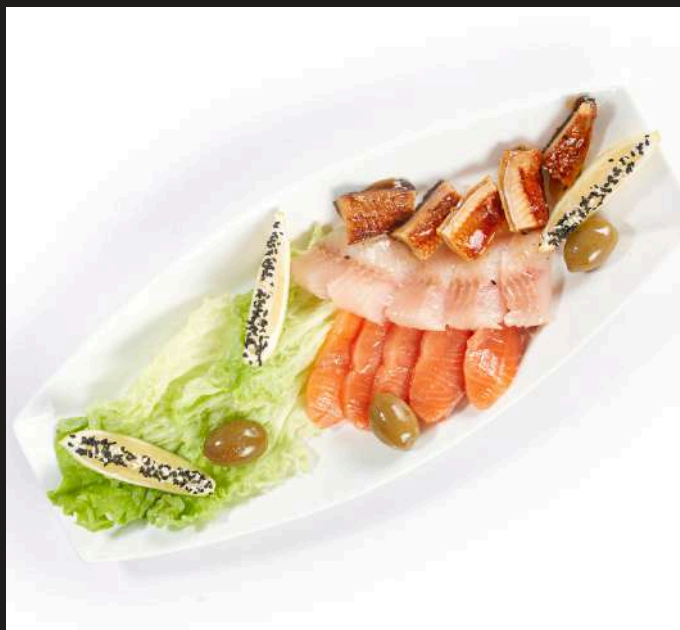
РЫБНОЕ АССОРТИ 1350₺ СЕМГА МАЛОЙ СОЛИ, ОМУЛЬ МАЛОЙ СОЛИ, УГОРЬ ХОЛОДНОГО КОПЧЕНИЯ 180 Г