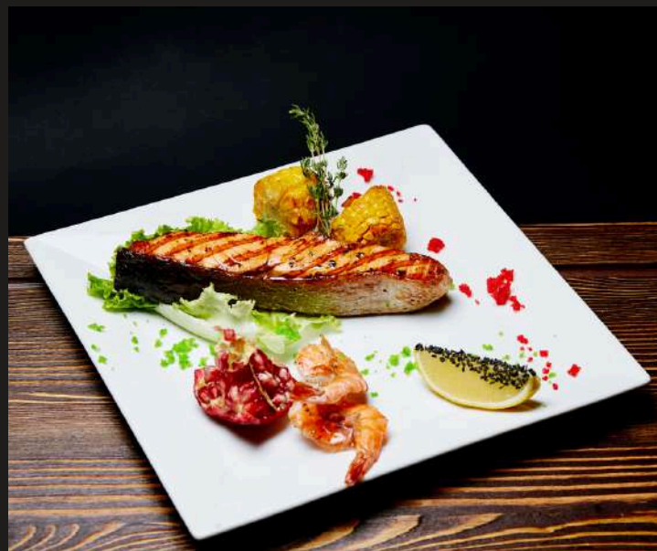
СЕМГА за 100 г 930 ₺