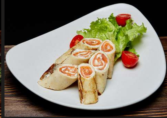
БЛИНЧИКИ С СЕМГОЙ 710 ₽ СЕМГА, СЫР ТВОРОЖНЫЙ 180/40 Г БЛИНЧИКИ С ИКРОЙ ЛОСОСЯ 910 ₽ ИКРА ЛОСОСЯ, СЫР ТВОРОЖНЫЙ 170/40 Г