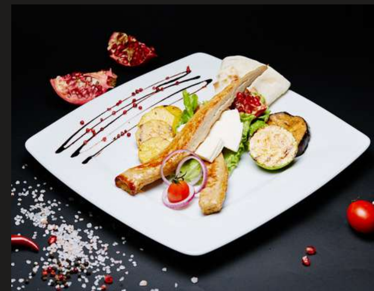
КУРИЦА РЕНЕССАНС (ФИЛЕ БЕДРА) за 100 г 340 ₺