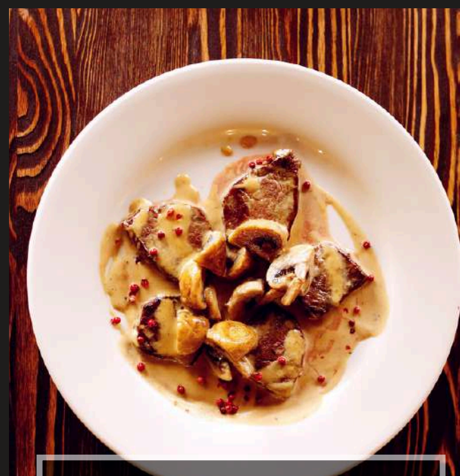
ФРИКАСЕ ИЗ ГОВЯДИНЫ 990 ₺ ФИЛЕ ГОВЯДИНЫ, ШАМПИНЬОНЫ СВЕЖИЕ, СЛИВКИ, КОНЬЯК/ 240 г

ПО ЖЕЛАНИЮ, ДЛЯ ВАС ПОДАДУТ БЛЮДО С ПРЕЗЕНТУЕМЫМ ГАРНИРОМ, СТОИМОСТЬ ГАРНИРОВ РАССЧИТЫВАЕТСЯ ОТДЕЛЬНО