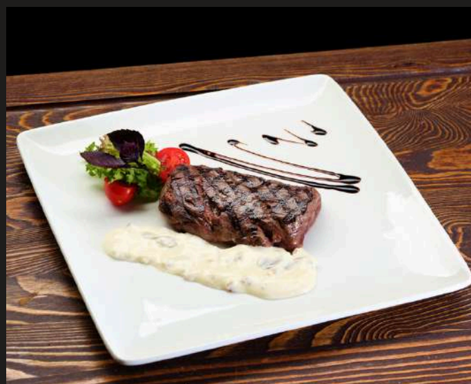
ОЛЕНИНА С ГРИБНЫМ СОУСОМ 150/50 г 1100 ₺