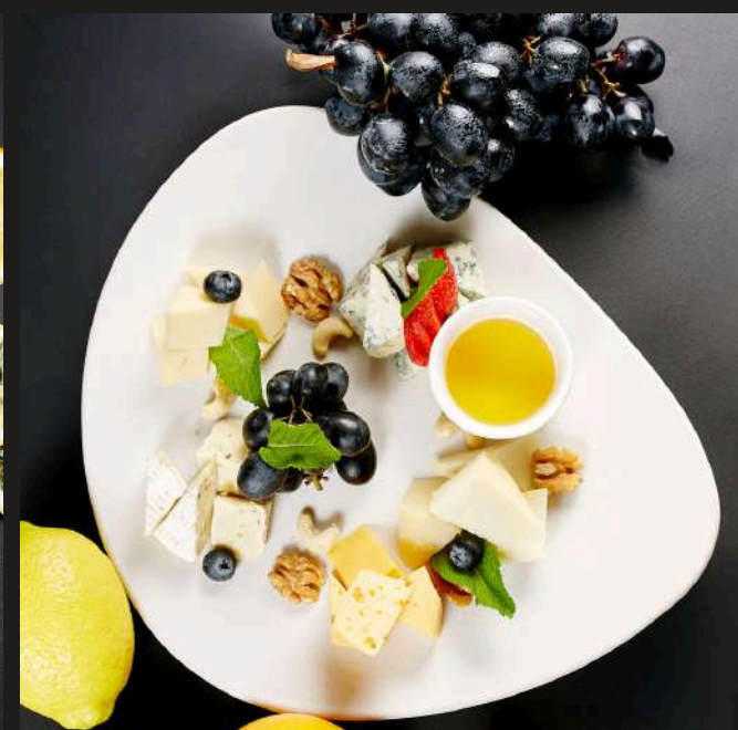
СЫРНОЕ ПЛАТО 1100 ₽ ПАРМЕЗАН, ДОРБЛЮ, БРИ, СЫР С НАПОЛНИТЕЛЕМ, МААСДАМ, МЕД, ГРЕЦКИЙ ОРЕХ/200 Г