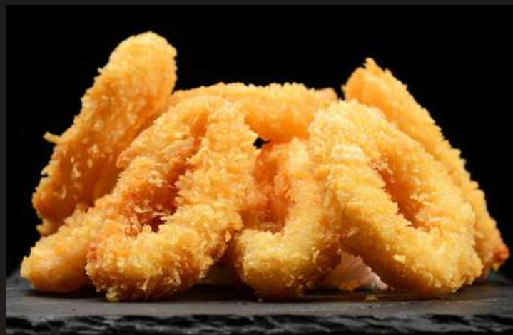
КОЛЬЦА КАЛЬМАРА В ПАНИРОВКЕ С СОУСОМ ТАРТАР 150/50 г 550 ₺