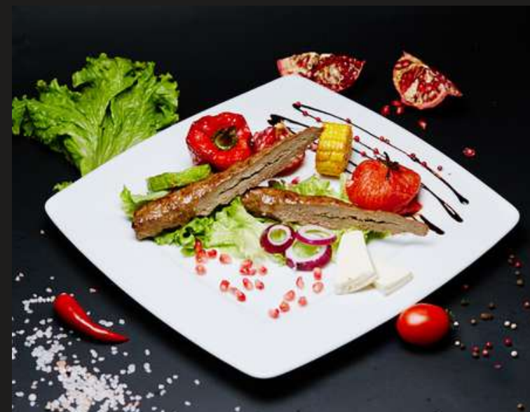
ЛЮЛЯ-КЕБАБ ИЗ БАРАНИНЫ за 100 г 460 ₺