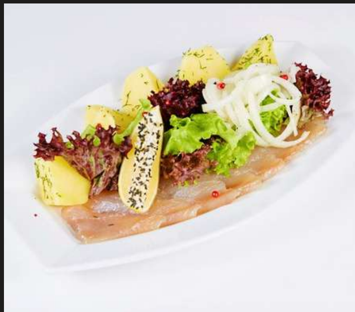
ОМУЛЬ С ОТВАРНЫМ КАРТОФЕЛЕМ 220/50Г 690₺