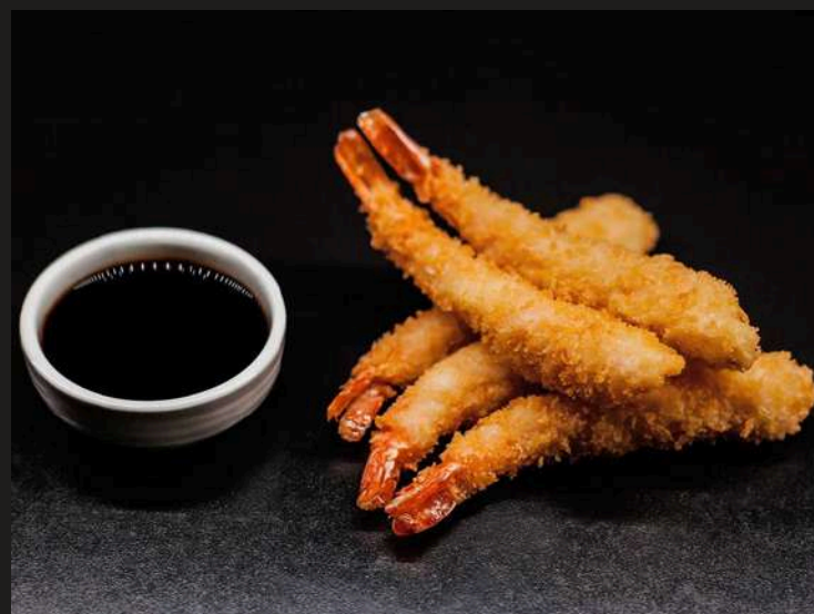
ТИГРОВЫЕ КРЕВЕТКИ В ПАНИРОВКЕ С СОУСОМ ТЕРИЯКИ 150/50 г 750 ₺