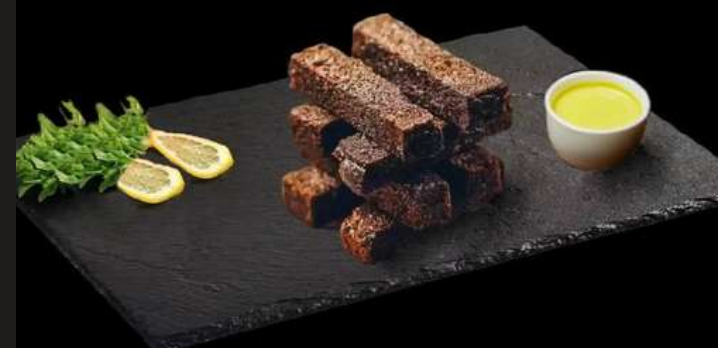
ГРЕНКИ ЧЕСНОЧНЫЕ С СЫРНЫМ СОУСОМ 120/30 Г 350 ₽