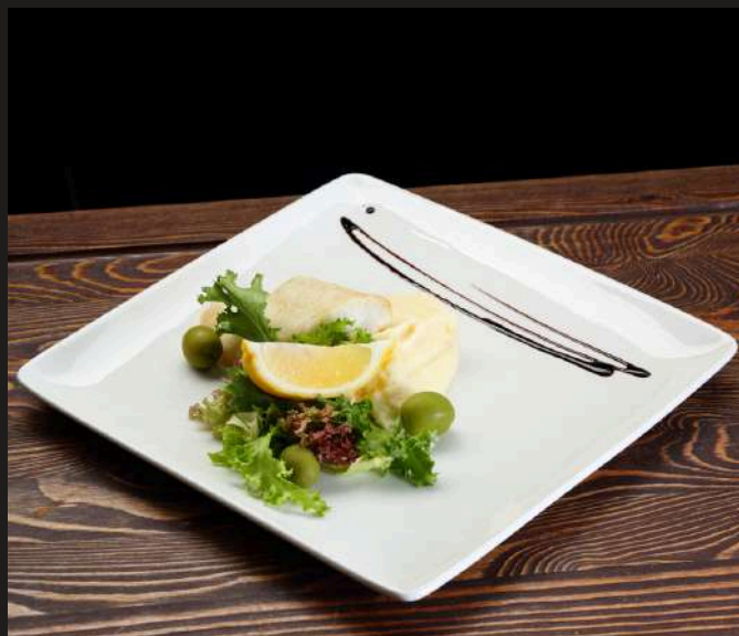
ПАЛТУС С КАРТОФЕЛЬНЫМ ПЮРЕ 120/150 г 690 ₺