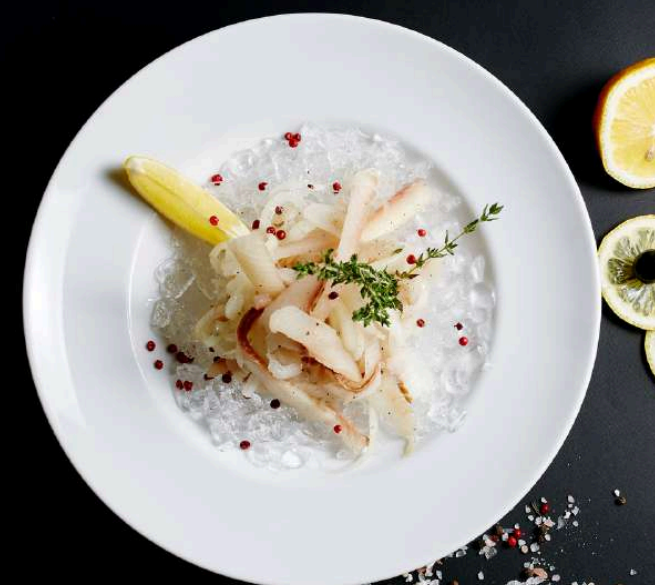
СУГУДАЙ ИЗ МУКСУНА НА ФРАППЕ 100/30 Г 790 ₽