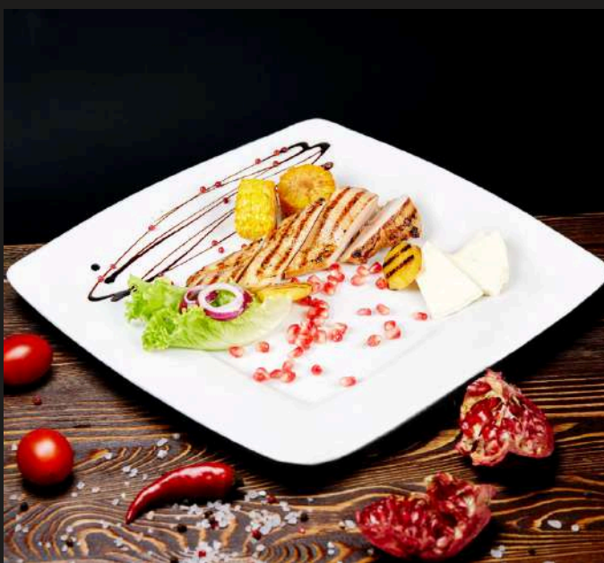
КУРИНОЕ ФИЛЕ за 100 г 340 ₺ КУРИНОЕ ФИЛЕ БЕДРА за 100 г 340 ₺