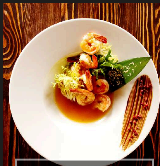
ТИГРОВЫЕ КРЕВЕТКИ С СОУСОМ ЧИЛИ/ 90 г 690 ₺