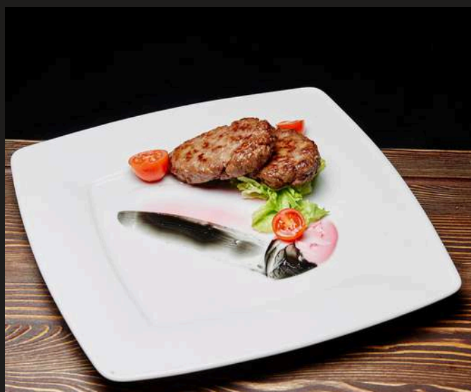
КОТЛЕТЫ ПО-ДОМАШНЕМУ ИЗ МЯСА ЛОСЯ 200 г 650 ₺