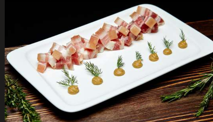
САЛО СОЛЕНОЕ С ГОРЧИЦЕЙ 100/30 Г 320 ₽