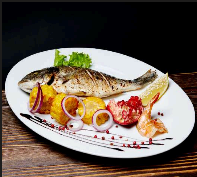
ДОРАДО за 100 г 370 ₺