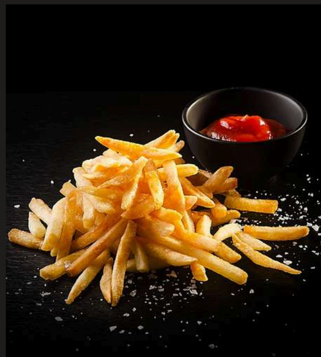
КАРТОФЕЛЬ ФРИ за 100 г 230 ₺