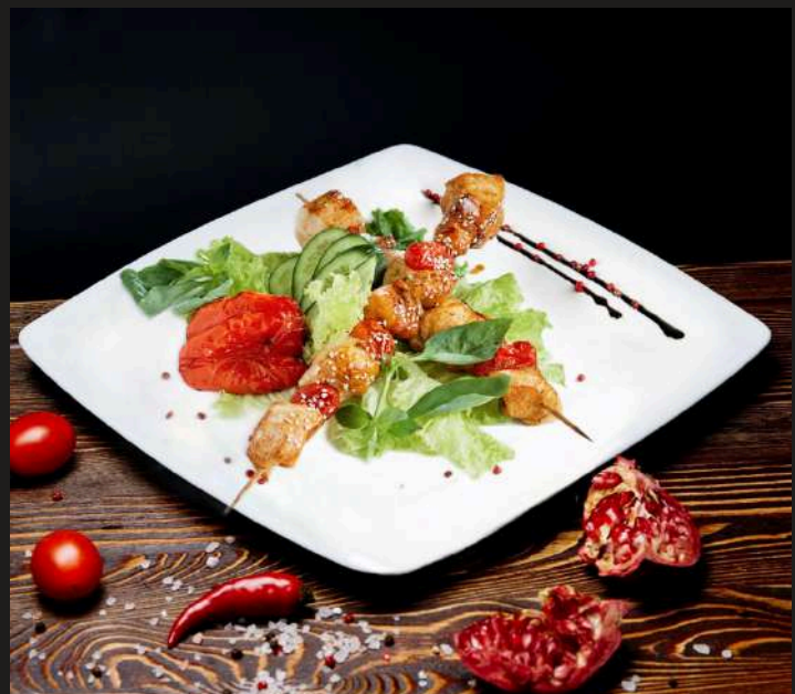
ШАШЛЫК ИЗ КУРИЦЫ за 100 г 340 ₺