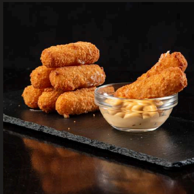
СЫРНЫЕ ПАЛОЧКИ С СОУСОМ ТАРТАР 150/50 г 420 ₺